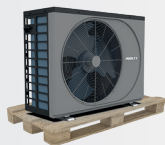
Livraison sur palette bois