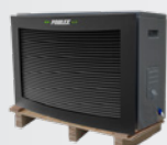
Livraison sur palette bois

La Jetline Premium Fi garde néanmoins tous les atouts qui ont fait son succès : son fonctionnement réversible lui permet de fonctionner dès -15°C, son dégivrage automatique et son échangeur twisted tech en titane garanti 15 ans. Certain de la fiabilité de nos produits, La Jetline Premium Fi est garantie 3 ans.